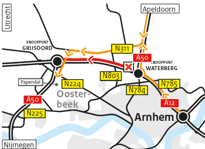
Naar Papendal en omgeving

Rijkswaterstaat voert vanaf vrijdagavond 27 juli 21.00 uur tot zondag 5 augustus 23.59 uur groot onderhoud uit op de A12/A50 tussen de knooppunten Waterberg en Grijsoord in de richting Utrecht. Gedurende deze periode is de A12/A50 tussen de knooppunten Waterberg en Grijsoord in de richting Utrecht volledig afgesloten. Het verkeer moet rekening houden met ernstige verkeershinder en verminderde bereikbaarheid van de regio Arnhem. De A12/A50 tussen Grijsoord en Waterberg in de richting Arnhem/Duitsland blijft open.